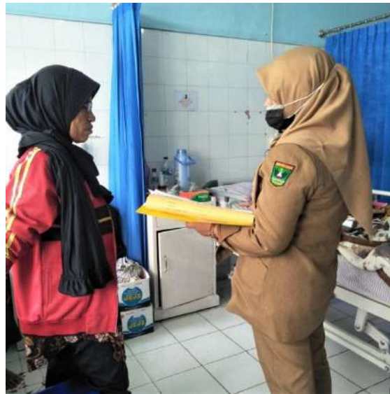
Tanya jawab dan diskusi dengan keluarga pasien