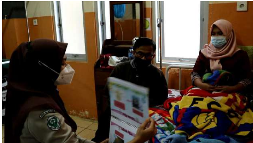
Edukasi menggunakan lembar balik