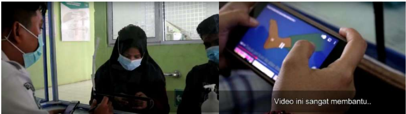
Edukasi menggunakan video