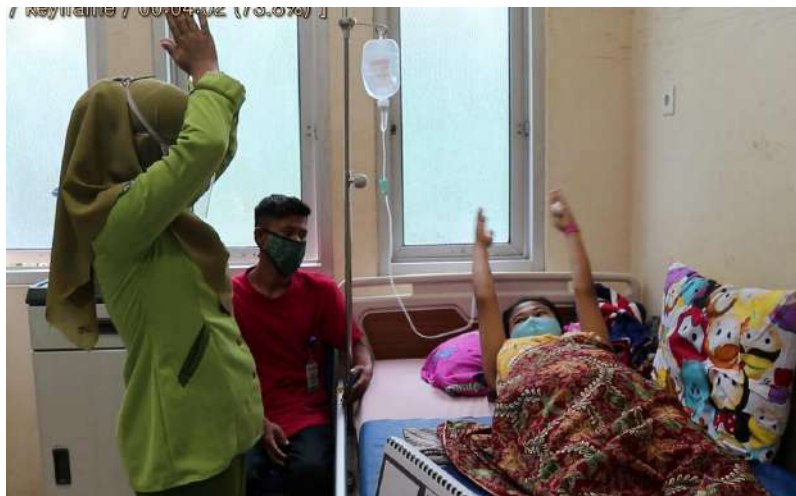
Praktek senam nifas