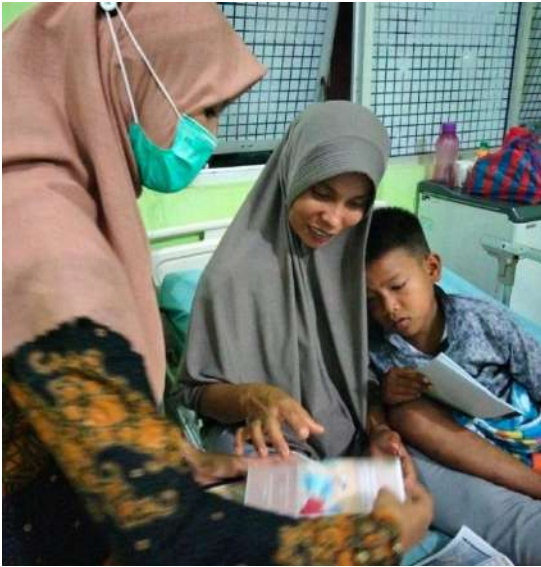
Edukasi menggunakan leaflet